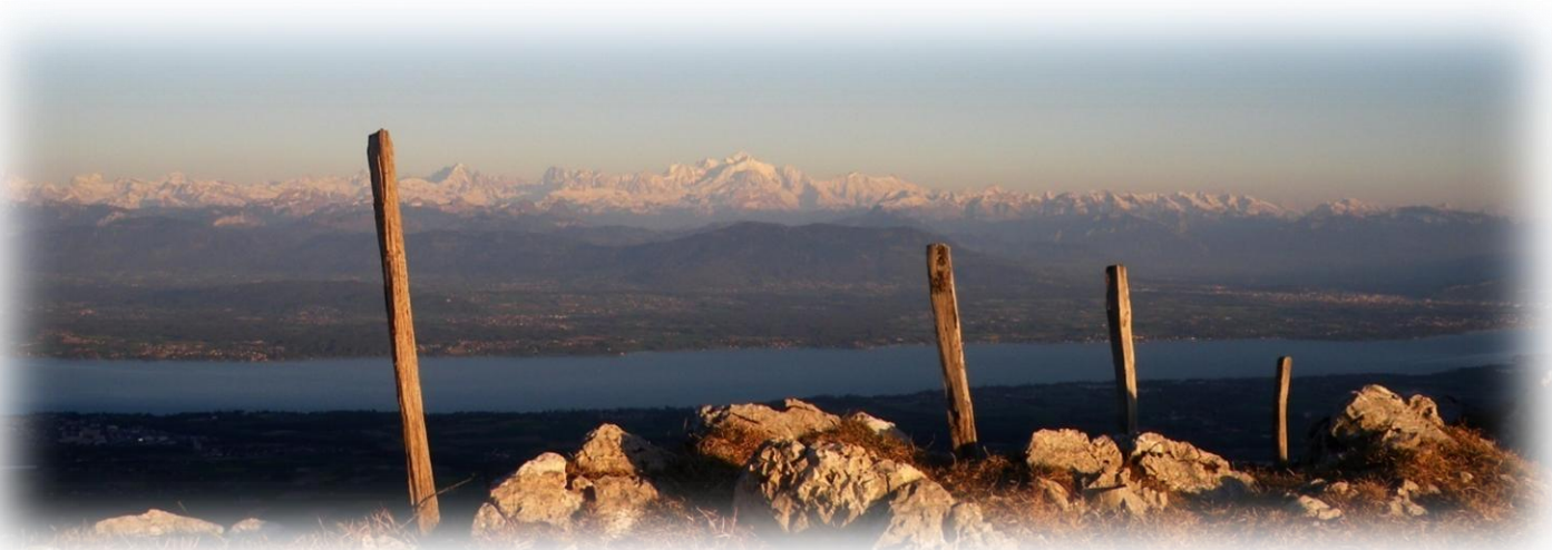
Panorama du sommet de la Dôle

L'hiver, cette randonnée sera remplacée par celle du Noirmont, également panoramique mais qui présente un terrain plus adapté à la pratique de la raquette à neige.